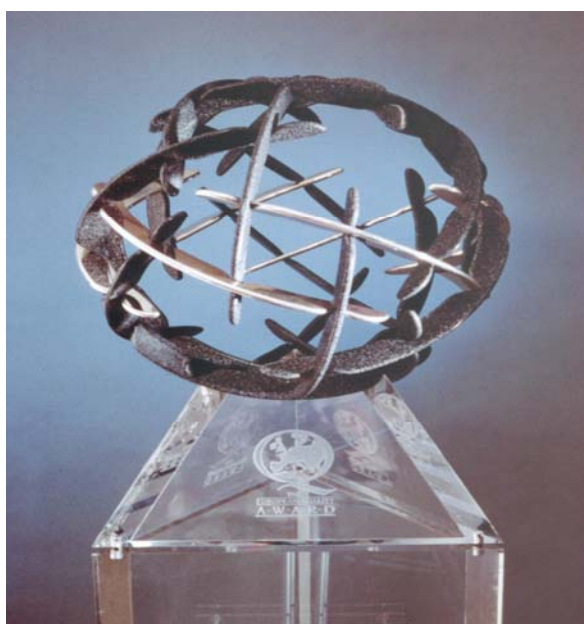
Rysunek 3. Przykład statuetki EQA [9].