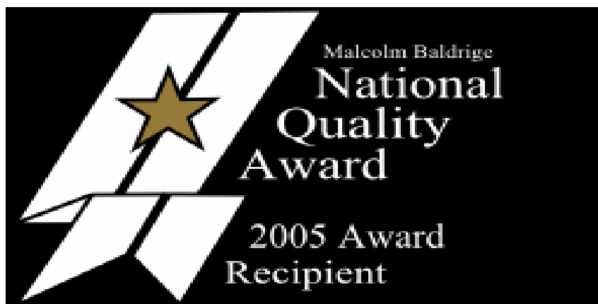
Rys. 3. Amerykańska nagroda jakości [7]