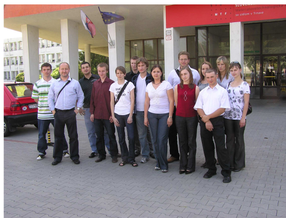
Wydział Technologiczny Słowackiego Uniwersytetu Technicznego w Bratysławie oddział w Trnawie.