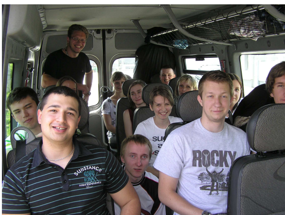
Członkowie Koła Naukowego podczas podróży na Słowację.