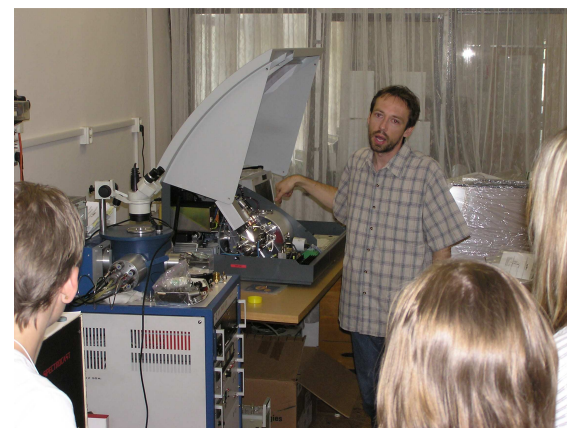
Laboratorium preparatyki transmisyjnej mikroskopii elektronowej.