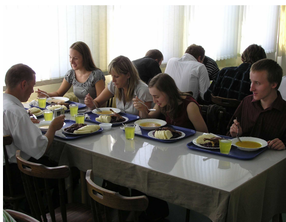
Wspólny obiad w stołówce Wydziału.