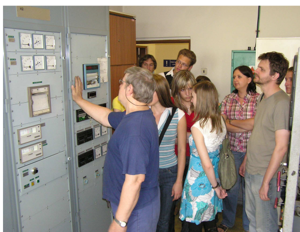
Laboratorium sterowania procesami metalurgicznymi.