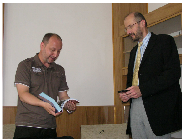
Prace Komitetu Naukowego Szkoły Inżynierii Materiałowej.