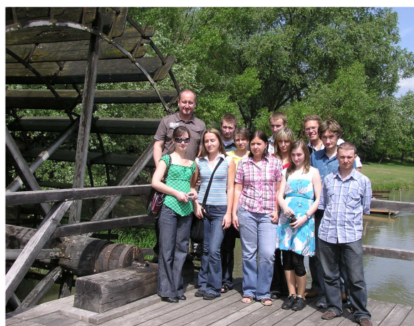
Zwiedzanie muzeum etnograficznego oraz zabytkowego młyna wodnego na Dunaju.