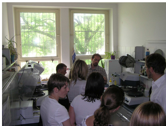
Laboratorium preparatyki skaningowej mikroskopii elektronowej.