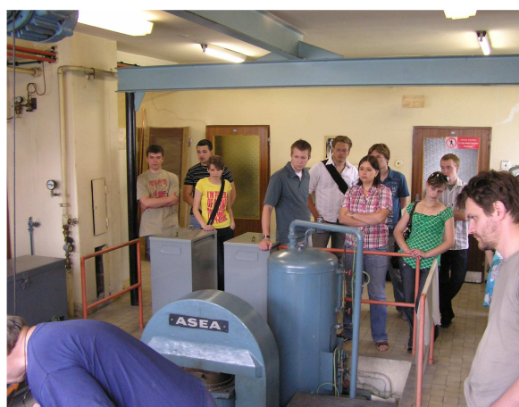
Laboratorium metalurgii proszków.